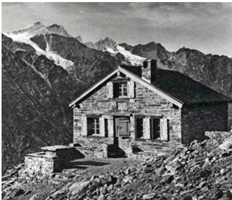
aus Clubhütten des Schweizer Alpen Club, 1927