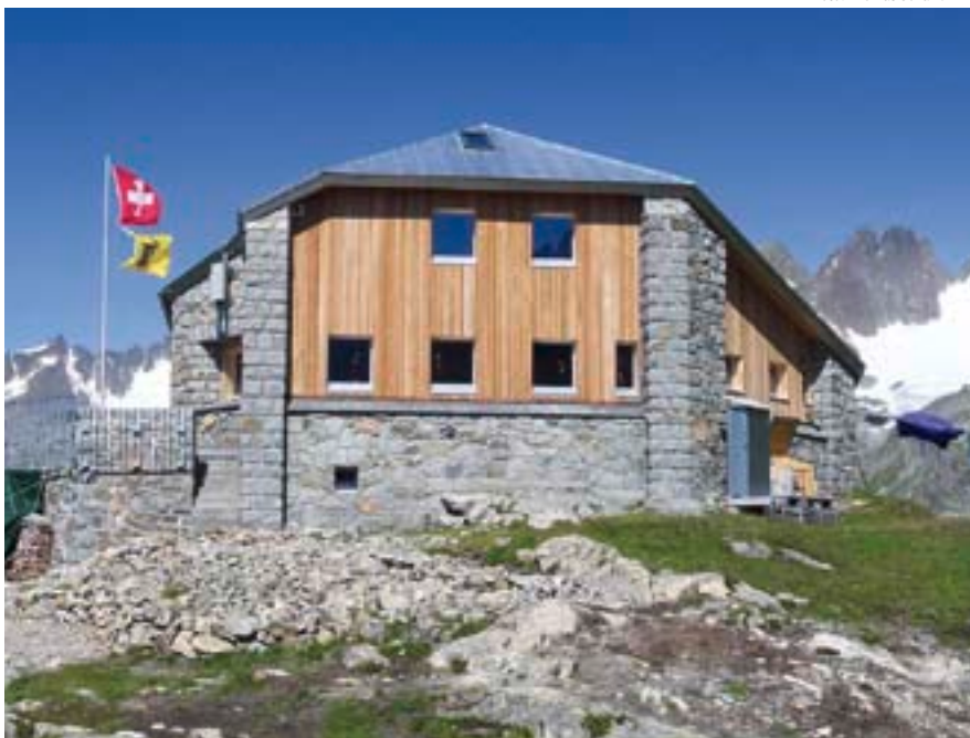
Typisch für Eschenmosers Bauweise ist die Seewenhütte. Dank einer aufwendigen Sanierung