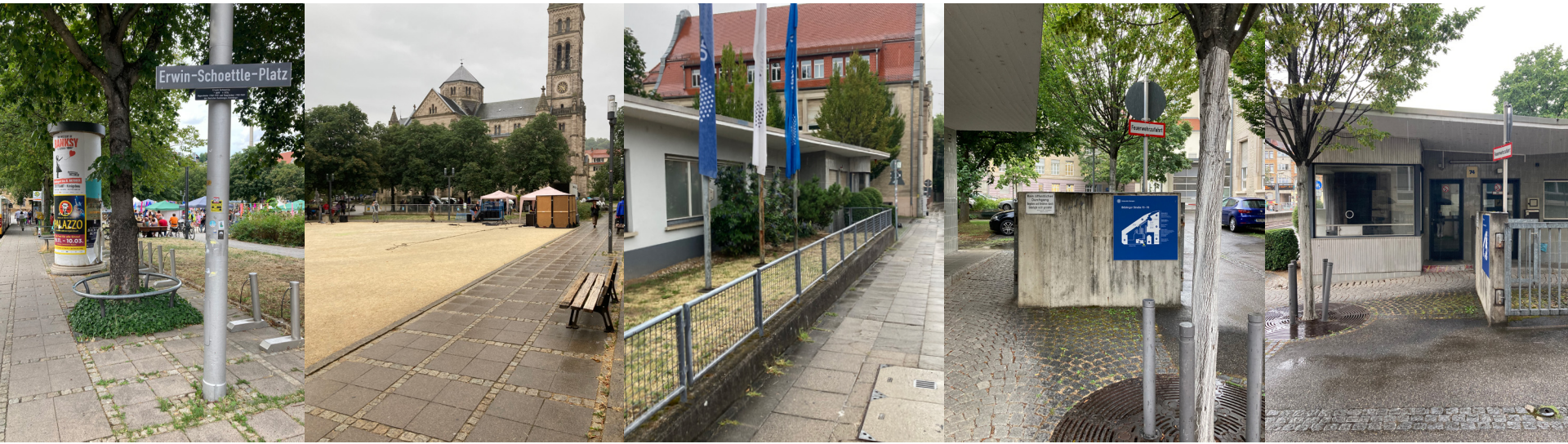
planungsgebiet & umgebung: erwin-schoettle-platz, pförtnerhäuschen