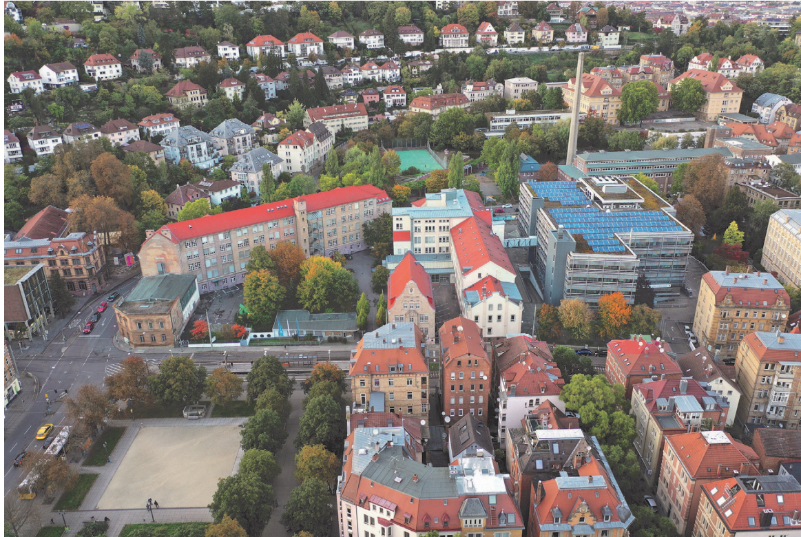
schoettle areal, stuttgart-süd https://www.iba27.de/projekt/schoettle-areal/