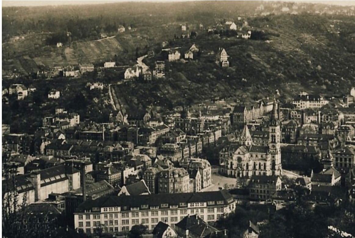
benger firmenareal und geschäftsgebäude um ca. 1930 https://www.imvt.uni-stuttgart.de/institut/geschichte/