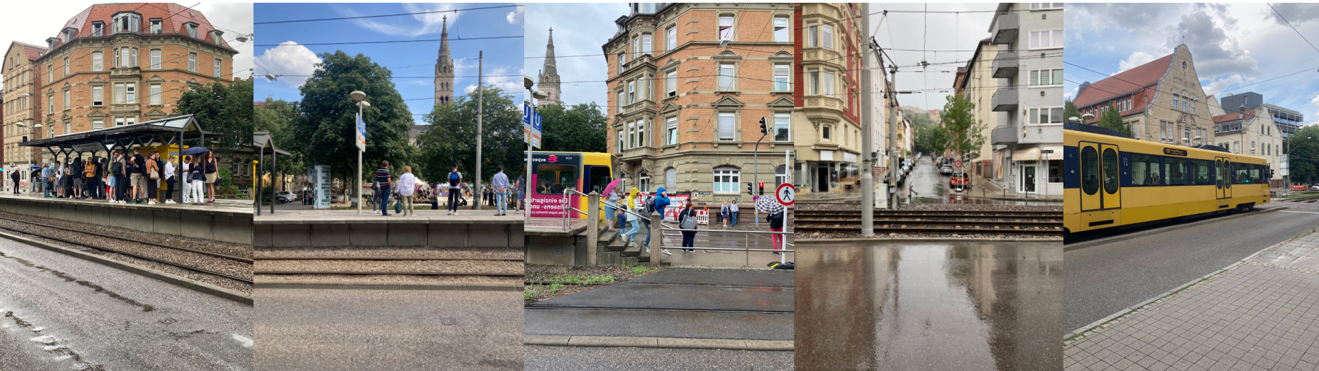
umgebung: u-bahn station erwin-schoettle-platz