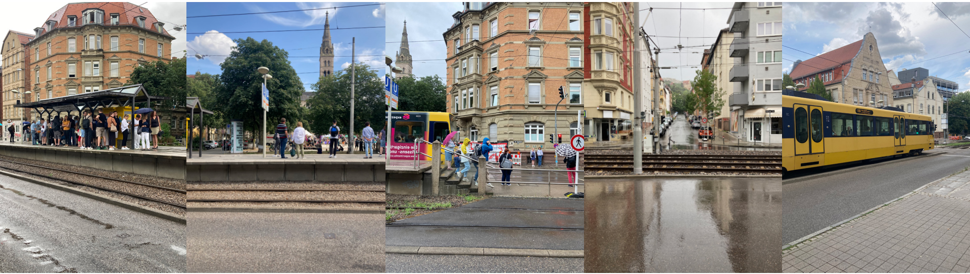
umgebung: u-bahn-station erwin-schoettle-platz